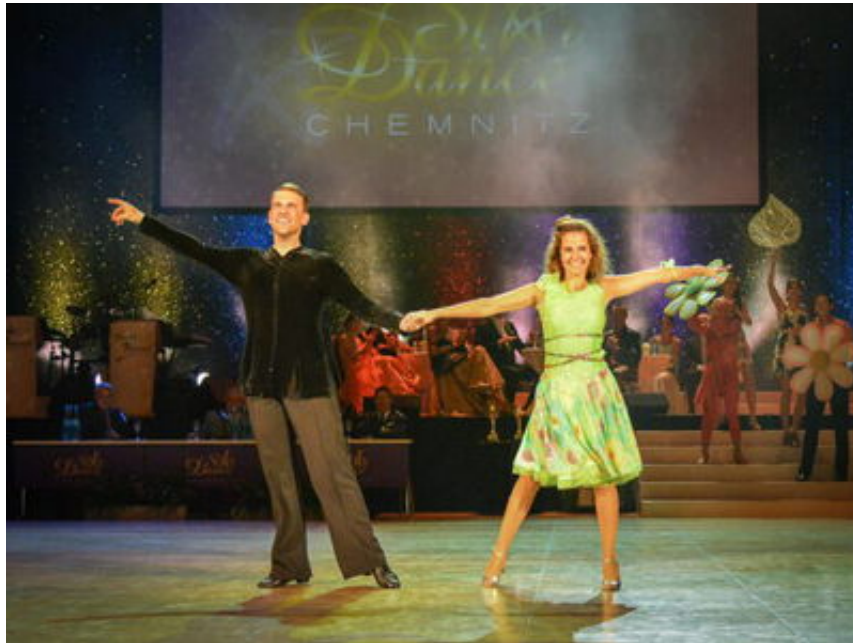
Stardance mit Tanzlehrer