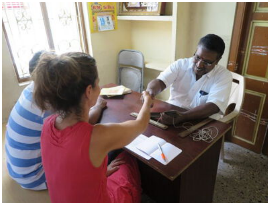
Palmblattlesung in Indien